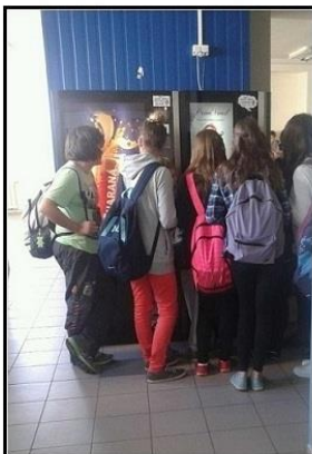
1) Obecny wygląd automatów (Duża szkoła z basenem w Olkusz)